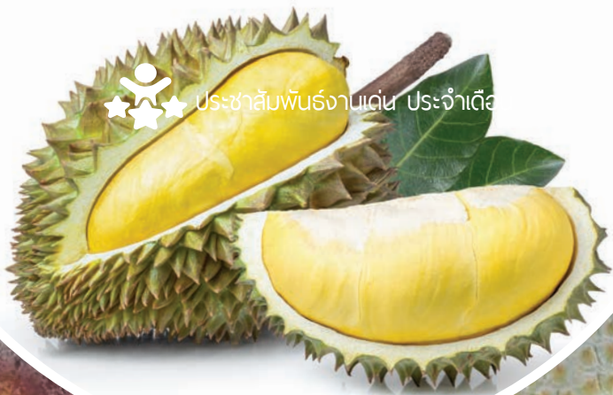
Durian Lava Sisaket