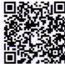
ใบสมัครและเอกสารโครงการ

วิทยาลัยการจัดการอุตสาหกรรมบริการ โทร ๐๙๙ ๐๕๑ ๓๓๔๔, ๐๙๙ ๐๙๗ ๔๔๘๘ E-mail : ssru.coaching@gmail.com