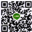
กลุ่มหลักสูตร ITA

คณบดีวิทยาลัยการจัดการอุตสาหกรรมบริการ ปฏิบัติราชการแทนอธิการบดีมหาวิทยาลัยราชภัฏสวนสุนันทา