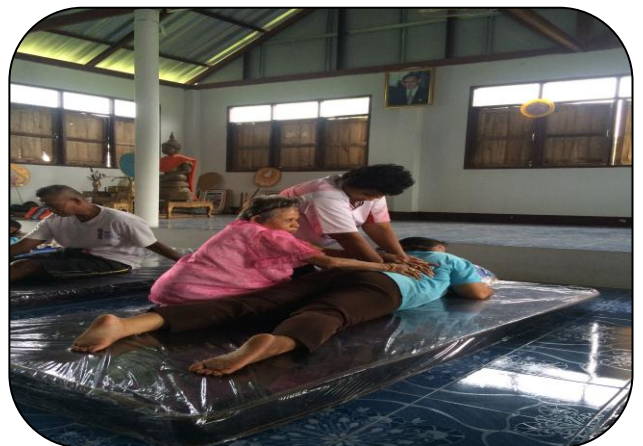
หลักสูตรการนวดแผนไทย