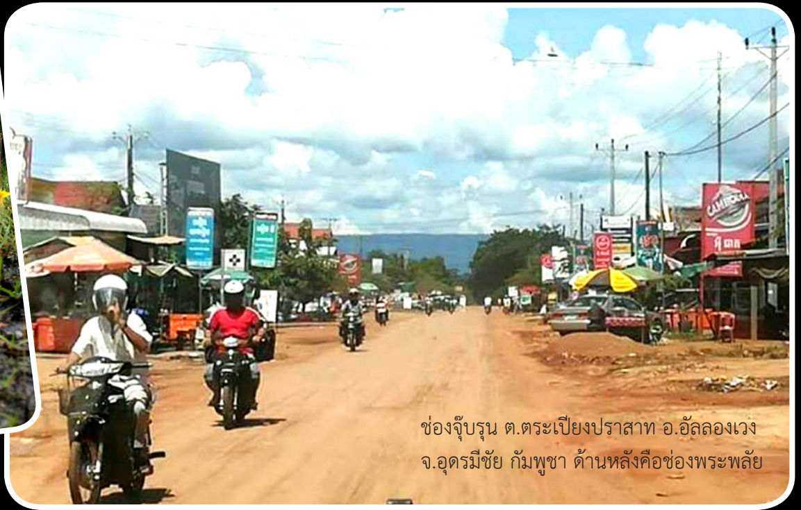
ช่องจู้บรุน ต.ตระเปียงปราสาท อ.อัลลองเวง จ.อุตรดิตถ์ กัมพูชา ด้านหลังคือช่องพระพลัย

ไปถึงสามแยก เลี้ยวขวาจะไปยังอ.อัลลองเวง เมืองแห่งอัญมณี ศูนย์กลางประวัติศาสตร์กลุ่มเขมรแดง สามารถเดินทางต่อไปยัง จ.เสียมเรียบขมนครวัดนครธม ถ้าเลี้ยวซ้ายจะเป็นเส้นทางไปสู่ อ.จอมกระ ซานต์ จ.พระวิหาร ซึ่งมีแหล่งท่องเที่ยวที่สำคัญที่สำรวจได้แล้วตอนนี้กว่า 1,000 แห่ง มีปราสาทที่โดดเด่นเช่น ปราสาทเกาะแกร์ ปราสาททรงปิระมิดที่อยู่ห่างจากช่องพระพลัย ประมาณ 50 กม.เท่านั้นเอง โดยปราสาทเกาะแกร์เมื่อขึ้นไปถึงจุดสุดยอดจะสามารถมองเห็นปราสาทพระวิหารได้อย่างชัดเจน