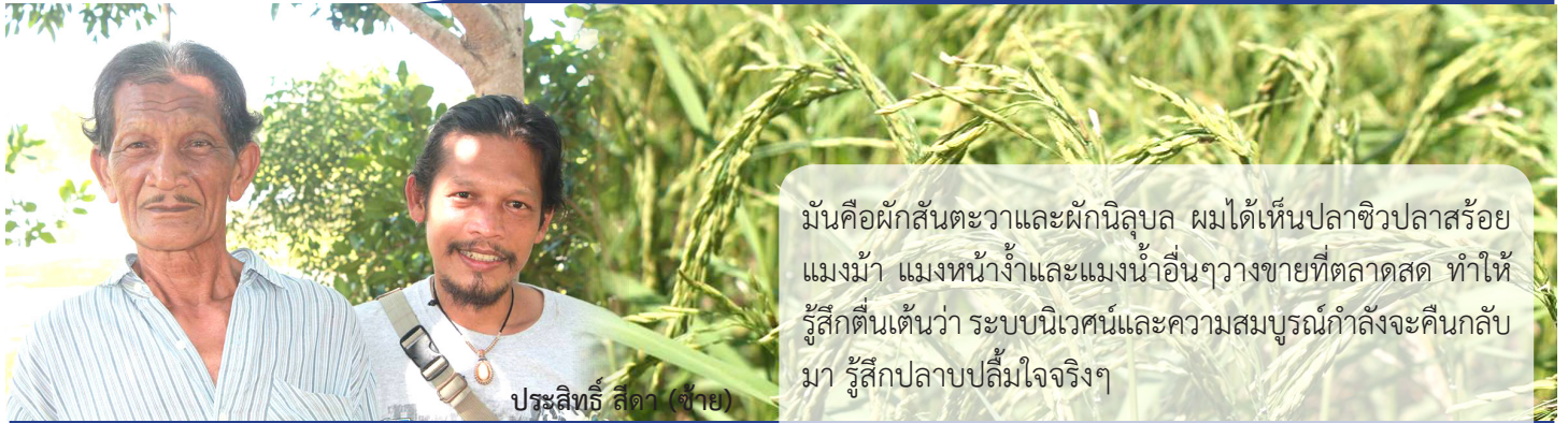
ประสิทธิ์ สีตา (ซ้าย)

มันเป็นผักสันตะวาและผักนิลูล ผมได้เห็นปลาชิวปลาสร้อย แมงม้า แมงหน้าง้ำและแมงน้ำอื่นๆวางขายที่ตลาดสด ทำให้ รู้สึกตื่นเต้นว่า ระบบนิเวศน์และความสมบูรณ์กำลังจะคืนกลับ มา รู้สึกปลาปลืมใจจริงๆ